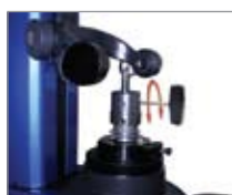
Поверка точных буров