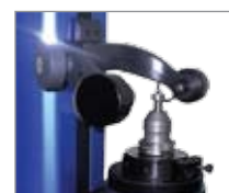
Поверка квадратных фрез