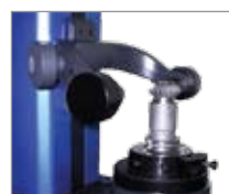
Поверка фрез для вытачивания фасок