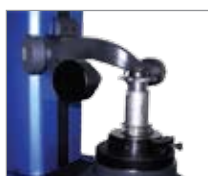
Поверка дисковых фрез