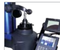
Поверка радиусных фрез