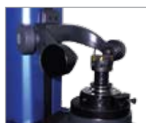
Поверка угловых фрез