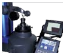
Поверка двухканавочных фрез